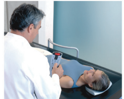
Création Elixir. Besançon. 03 81 81 28 75.

Les performances technologiques et la fiabilité wellsystem™ ne sont plus à démontrer. L'outil thérapeutique moderne HAUT de GAMME pour professionnels d'avant-garde soucieux d'apporter à leurs patients une véritable efficacité thérapeutique, une rapidité du résultat avec une assistance rentable sans faille.